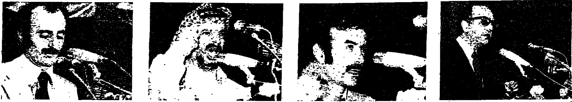
الوزير سلمان ■ ممثل سوريا السيد عبدالله الاحمد ■ السيد ياسر عرفات ■ السيد وليد جنبلاط ■